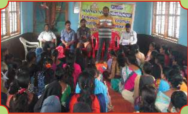
ಸ್ವ ಸಹಾಯ ಸಂಘದ ಮಹಿಳೆಯರಿಗೆ ಉದ್ಯಮತೀಲತಾ ತರಬೇತಿ