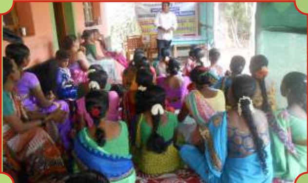
ಒಕ್ಕೂಟ ಸಭೆಯನ್ನುದ್ದೇಶಿಸಿ ಮಾತನಾಡುತ್ತಿರುವ ಸಂಸ್ಥೆಯ ಸಿಬ್ಬಂದಿ