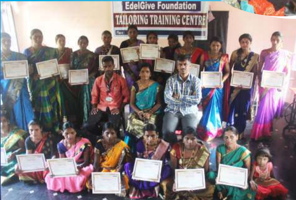
ಶಿರಸಿ ತಾಲೂಕಿನ ಕಾಯಿಗುಡ್ಡೆ ಹೊಲಿಗೆ ತರಬೇತಿಯ ಫಲಾನುಭವಿಗಳಿಗೆ ಪ್ರಶಸ್ತಿ ಪತ್ರ ವಿತರಣೆ