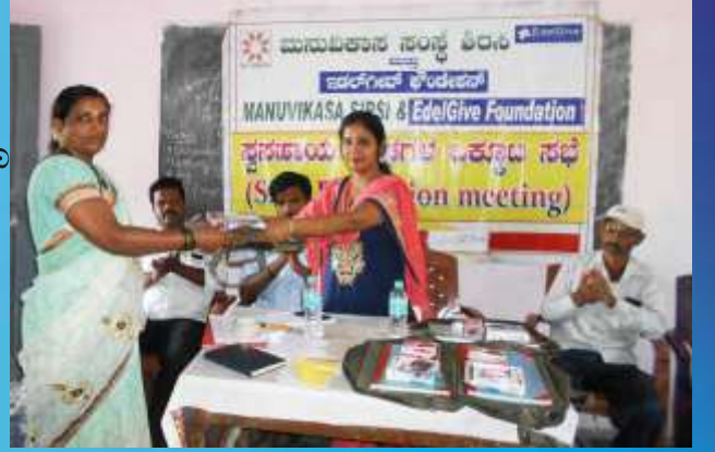
ಸ್ವ ಸಹಾಯ ಸಂಘದ ಮಹಿಳೆಯರಿಗೆ ಕಿಟ್ ವಿತರಣೆ