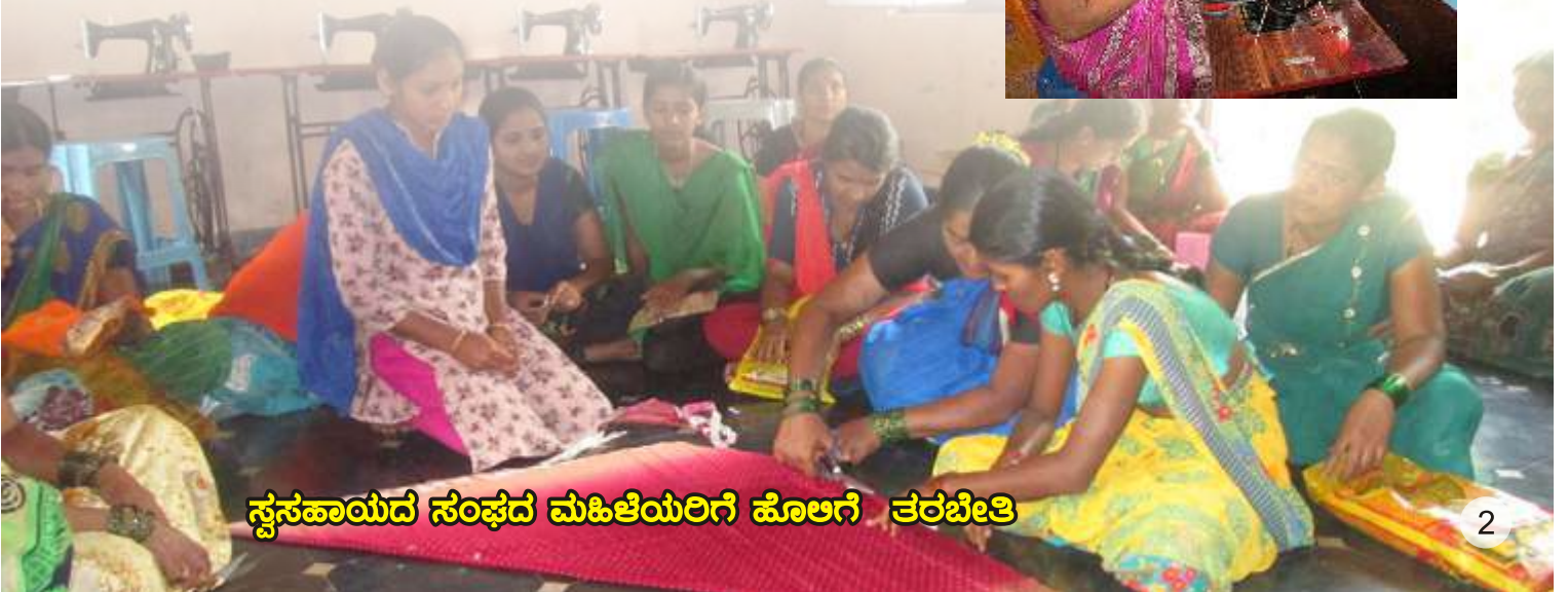
ಸ್ವಸಹಾಯದ ಸಂಘದ ಮಹಿಳೆಯರಿಗೆ ಹೊಲಗೆ ತರಬೇತಿ